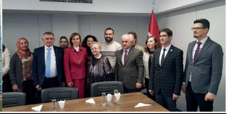
International Maarif Schools of Bucharest'in, 24 Kasım Öğretmenler Günü vesilesi ile düzenlediği etkinliği katıldık. 25.11.2019