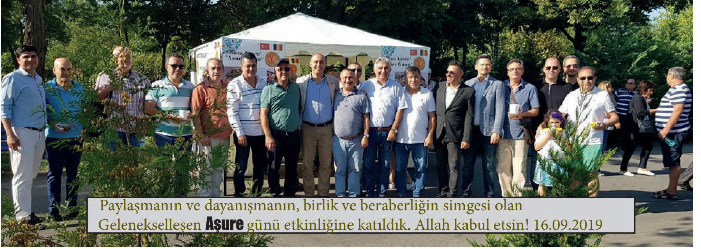
Paylaşmanın ve dayanışmanın, birlik ve beraberliğin simgesi olan Gelenekselleşen Asure günü etkinliğine katıldık. Allah kabul etsin! 16.09.2019