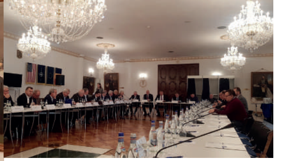
Romanya Ticaret ve Sanayi Odası (CCIR) tarafından düzenlenen, Olağanüstü Genel Kurul'da yeni yönetim kurulu seçimine katıldık 11/02/2020

Romanya Merkez Bankası (BNR) ev sahipliğinde, Avrupa Yatırım Bankası (EIB)'nin katkılarıyla düzenlenen "Romanya'da yatırım ve yatırım finansmanı, öncüler ve geç kalanlar" konferansına katıldık. Romanya'daki üst düzey firmaların ve